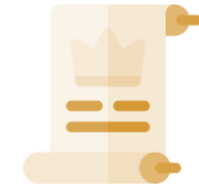
Prises de position