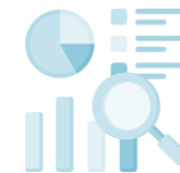
Études et enquêtes